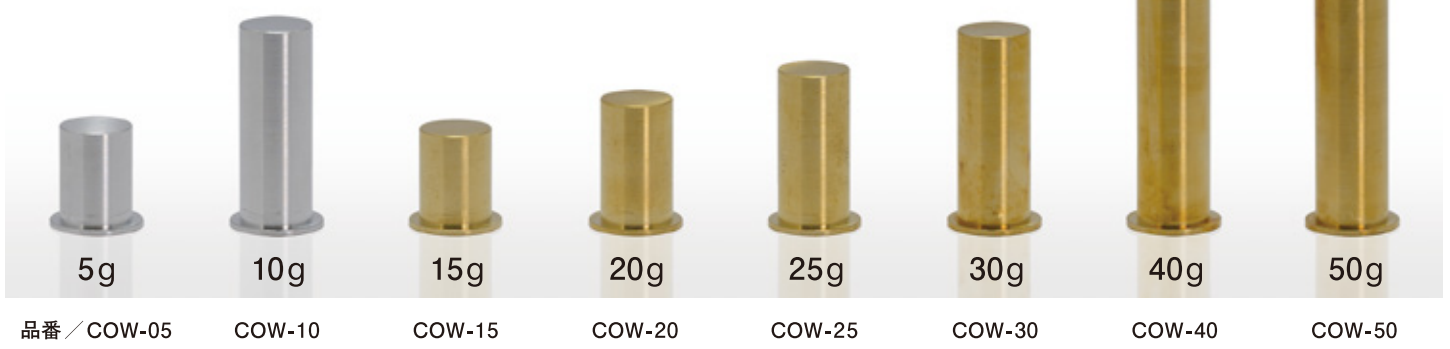
品番 / COW-05 COW-10 COW-15 COW-20 COW-25 COW-30 COW-40 COW-50

カウンターバランスに変更することで、 クラブが軽く感じられ振りやすさがアップ!!