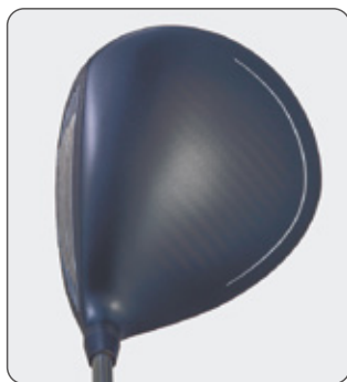
カーボンクラウン