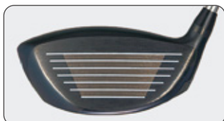
フェイスレーザーミーリング加工